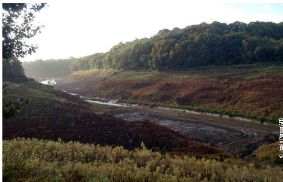
La Sélune dans l'ancienne zone de retenue de Vézins (Manche) le 26 Septembre.

international autour de la renaissance de la Sélune. Réunissant plus de 150 participants (chercheurs, associatifs, gestionnaires et collectivités), cet événement a éclairé les divers enjeux (écologiques, scientifiques, politiques, sociaux...) de la Sélune à la lueur de retours d'expériences du monde entier et a posé quelques jalons pour l'avenir de la vallée.