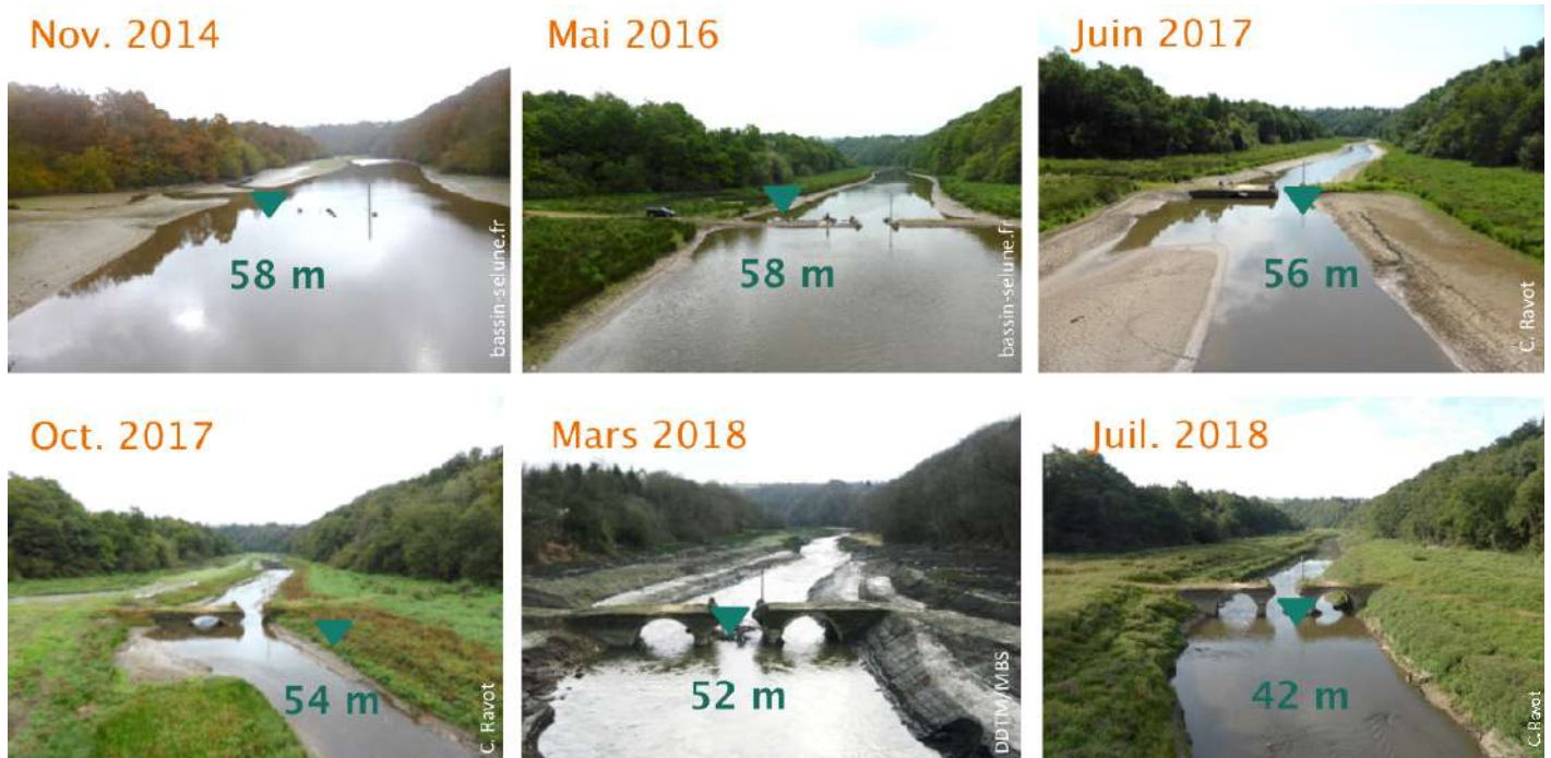
Figure 2. Évolution de la végétation au pont de la République (barrage de Vezins après exondation). (Source : Inra).

Le bassin de la Sélune, dont 77 % était jusqu'alors inaccessible, recèle des habitats historiquement très favorables aux espèces migratrices. Sur l'Oir, un affluent situé en aval des barrages, les scientifiques de l'Inra dénombrent ainsi chaque année les saumons, truites de mer et