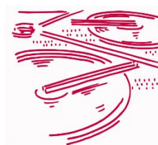
Hydraulique urbaine Eau et Assainissement

Les candidatures (CV et lettre de motivation) sont à adresser par mail à l'adresse : s.lamarque@nca-env.fr