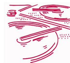
Hydraulique urbaine Eau et Assainissement

Vous êtes en moyenne 50 % du temps au bureau et 50 % du temps sur le terrain au contact des porteurs de projet et des entreprises de travaux.