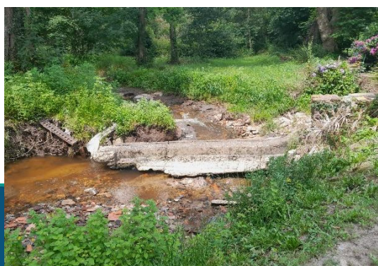
Dégâts post crues

Une partie de l'ouvrage 1 est resté accroché au mur du canal. Le pied du canal d'amené s'est fortement érodé au fil des montées d'eau ce qui a engendré un risque d'infiltration pour les fondations de la maison. Suite à ces dégâts de nouveaux devis ont été présentés aux propriétaires. Les scénarios de reconstruction, trop coûteux, ont été abandonnés par les propriétaires. L'alternative de démantèlement était donc l'alternative la plus adaptée pour eux.