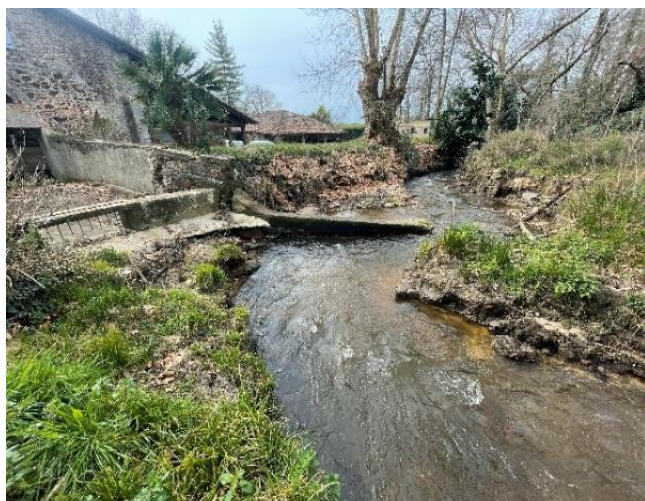
Seuil 1 en amont contourné

L'incision du lit, provoquée par la rupture du premier seuil, a entraîné la chute du deuxième seuil en aval. La ligne d'eau s'est abaissée très rapidement provoquant une forte érosion régressive (plus d'un mètre d'incision sur certaines portions).