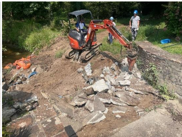
Photos pendant travaux, découpage seuil béton