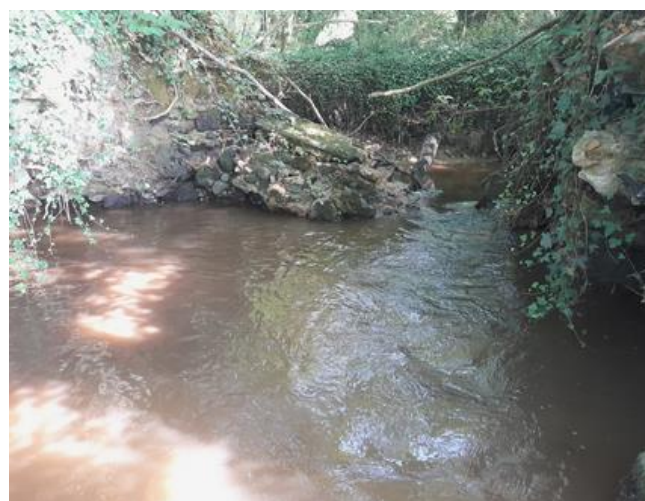
Seuil 2 en aval contourné

Une partie de l'ouvrage 1 est resté accroché au mur du canal. Le pied du canal d'amené s'est fortement érodé au fil des montées d'eau ce qui a engendré un risque d'infiltration pour les fondations de la maison. Suite à ces dégâts de nouveaux devis ont été présentés aux propriétaires. Les scénarios de reconstruction, trop coûteux, ont été abandonnés par les propriétaires. L'alternative de démantèlement était donc l'alternative la plus adaptée pour eux.