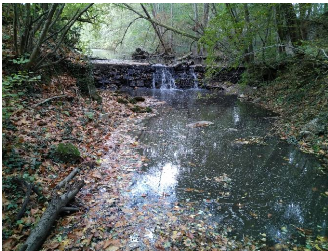
Photo du déversoir avant travaux

L'amont de l'étang est occupé par un boisement humide d'environ 8 000m 2 induit par la présence de l'étang. Le caractère humide de ce site doit perdurer après les travaux de restauration de la continuité écologique (RCE) de l'étang. Un suivi piézométrique a donc été mis en place.