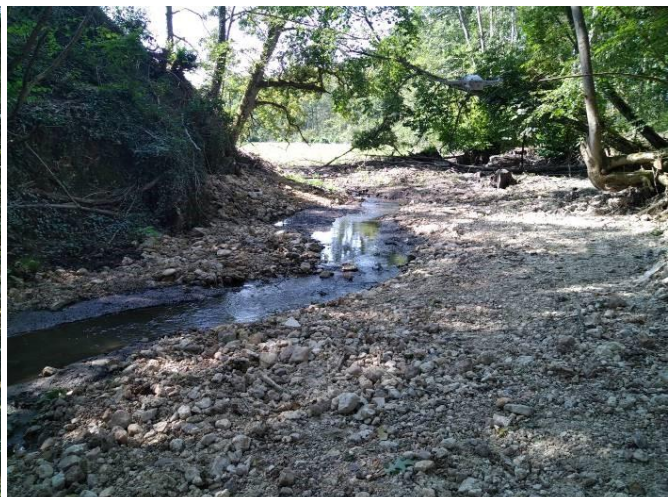
Photo après travaux à l'emplacement du déversoir

Vidéo des travaux : https://www.youtube.com/watch?v=6wzDYhEKi4s