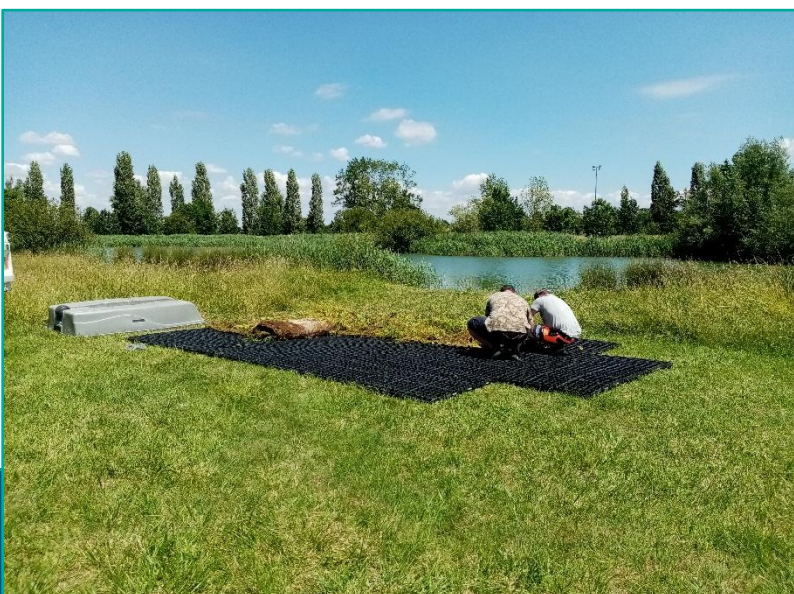
Photo de l'étang avec le radeau végétalisé